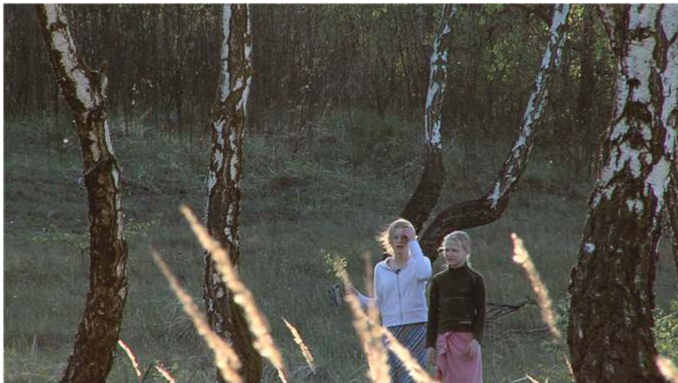
„Namiot”, 2007, wideo 2:45 min. (pętla), kanał pierwszy

Cykl „Hazard” jest o ryzyku, które jest nieśmiertelnym współtwórcą naszego doświadczenia, funkcją podrywającą nasz chaotyczny świat do ruchu. Chodzi o ryzyko jako pewien wszechobecny potencjał, możliwość niepowodzenia. Nadzieja na sukces, która nieodłącznie idzie w parze z groźbą porażki. Taka ambiwalentna groteska, która w pewnym sensie, towarzyszy każdemu, najbardziej prozaicznemu nawet działaniu. Ciąg przyczyn i skutków naszych poczynań i rzeczy, które dzieją się wokół jest nie do rozgryzienia. Napewno nie w czasie rzeczywistym. To skrajnie skomplikowana matematyka. Otacza nas piękny chaos. W sobie też mamy piękny chaos.