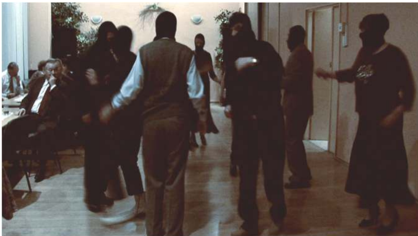
„Bal”, 2007, wideo 4:30 min. (pętla)

Budując sytuacje przedstawione na naszych wideo próbowaliśmy uchwycić pewnego rodzaju elementarny nastrój, który odnaleźć można zarówno w greckich tragediach, baśniach braci Grimm jak i scenariuszach von Triera. Chcieliśmy odnaleźć jakiś wspólny mianownik tych historii, ten pierwiastek, który obecny jest przecież również w naszym codziennym doświadczeniu. W szkole uczyliśmy nas, że chodzi tu o fatum, ale my wiemy, że jest to raczej ryzyko którym oddychamy, nieprzewidywalność chaosu w którym żyjemy, i który nosimy w sobie. Raz na wozie, raz pod wozem. Na kogo wypadnie, na tego bęc.