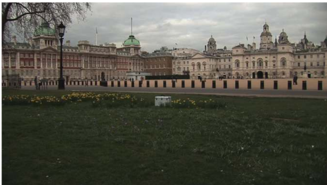
„Walizka”, 2008, wideo 13 min. (pętla)

Cykl „Hazard” realizowany jest przez grupę 4! od 2007 roku. Do tej pory powstały cztery obrazy wideo: „Namiot”, „Bal”, „Siekiera” i „Walizka”. Składają się one na wielokanałową, pełną wzajemnych zależności instalację wideo. Ścieżki dźwiękowe poszczególnych projekcji konkurują ze sobą w przestrzeni, nakładając się na siebie. „Siekiera” przez cztery minuty i pięćdziesiąt sekund zagłusza pozostałe projekcje, aby następnie zamilknąć na pięć minut i dziesięć sekund. „Bal” wypełnia przestrzeń naprzeciwległą, poddana prostemu zniekształceniu muzyka uwypatnia oniryczny nastrój obrazu. W tej samej przestrzeni, lecz jakby na uboczu znajduje się „Namiot” - dwie zsynchronizowane projekcje o identycznym wymiarze i czasie trwania, wyswietlane jedna obok drugiej. „Walizka” stanowi początek drugiej części cyklu, której tematem ma być „martwa natura w akcji”, bezwiednie budząca się do życia w przestrzeni wypełnionej szumem. W realizacji epizodów „Namiot” i „Bal”, oprócz obecnego składu grupy, brał jeszcze udział Paweł Dziemian.