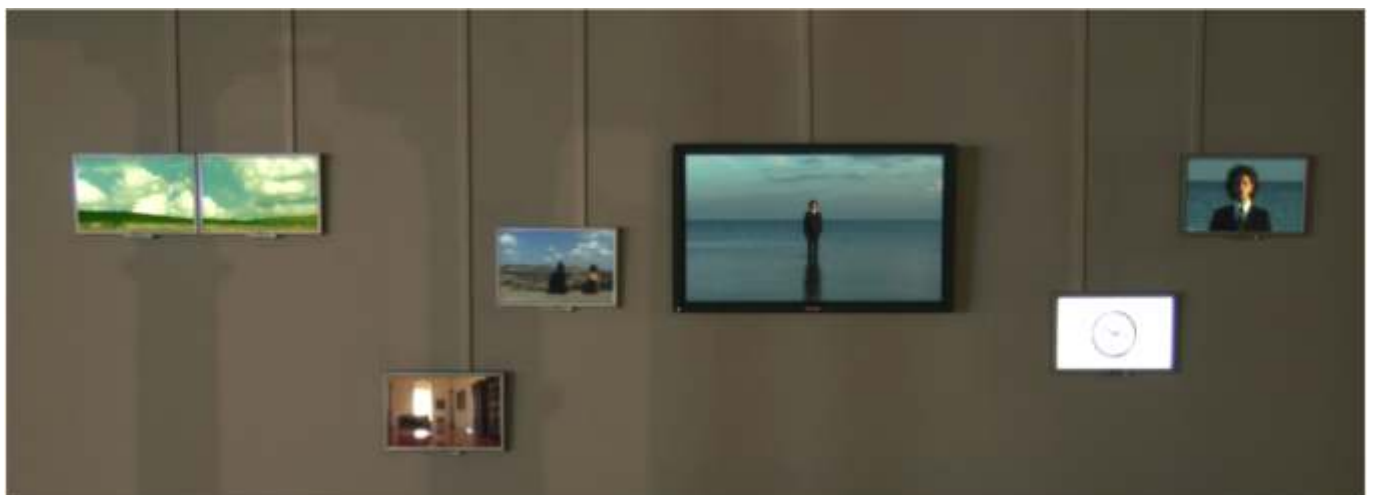
Timeless 2.0 na wystawie Imperium Zmysłów, Galeria Słodownia, Stary Browar w Poznaniu, 2007

Paweł Leszkowicz, frag. tekstu z katalogu wystawy Imperium Zmysłów