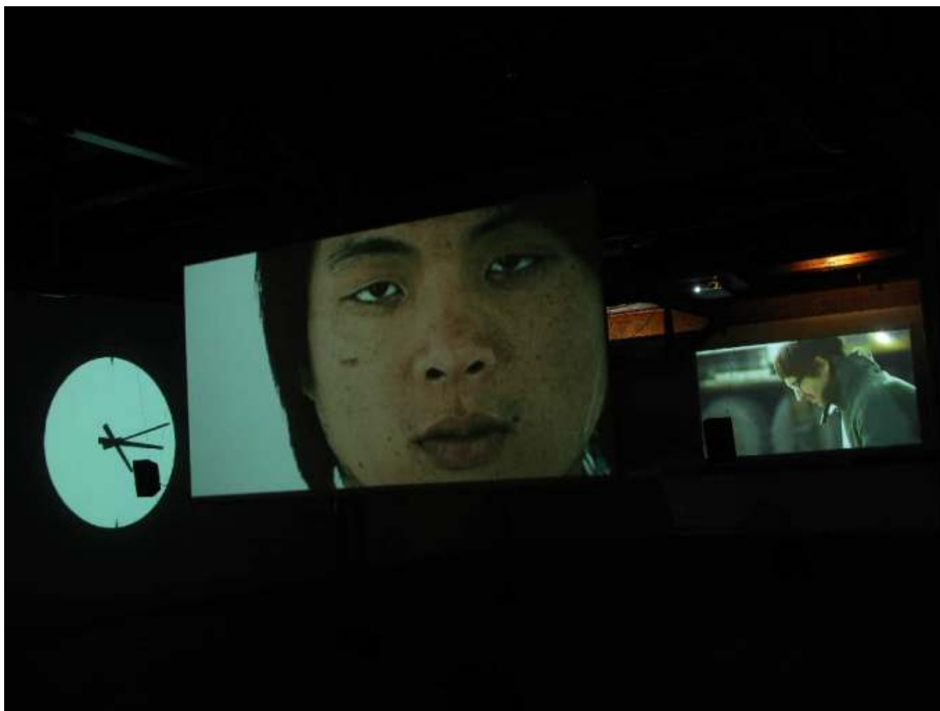
instalacja w Galerii Słodownia, Stary Browar w Poznaniu, 2006

Krzysztof Pijarski, frag. tekstu z katalogu wystawy Imperium Zmysłów